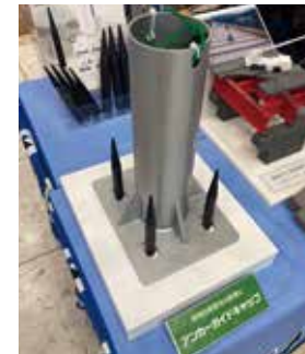
照明柱・信号柱・鋼管柱の設置に