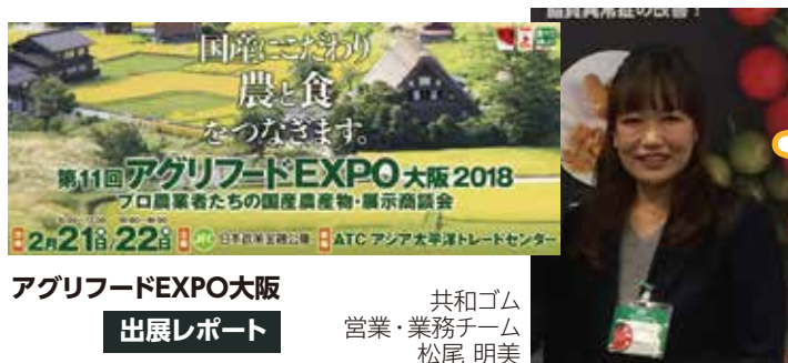
アグリフードEXPO大阪 出展レポート