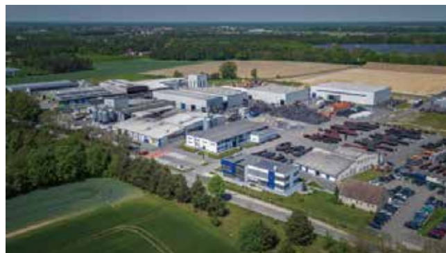
▲ クライブルグ社本社

クライブルグ社はドイツ南部に本社を置いており、屋内・屋外で使用される様々なゴムラバー製の表層材や発泡ウレタン製の構造材を製造し、多様なニーズに応えられる高品質で優れた製品を世界中の国々へ提供しています。特にヨーロッパ内での実績が膨大にあります。