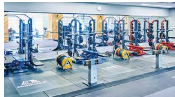
▲ 鏡の境目とトレーニング機器の配置が被らないようにしている

弊社は、材料の仕入販売だけでなく、設計・施工など顧客の細かいニーズに合わせたレベルの非常に高い対応をすることが出来ます。