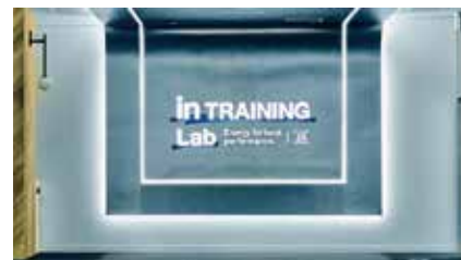
◀ 森永製菓in トレーニングラボ